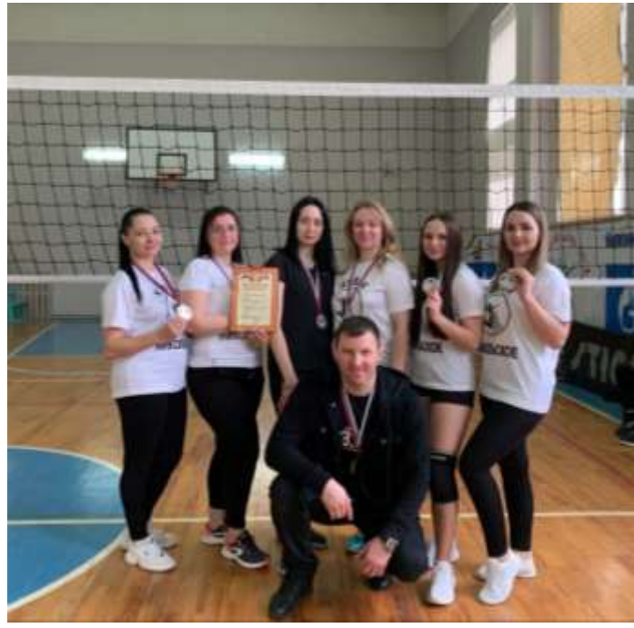
«Районные соревнования по волейболу»