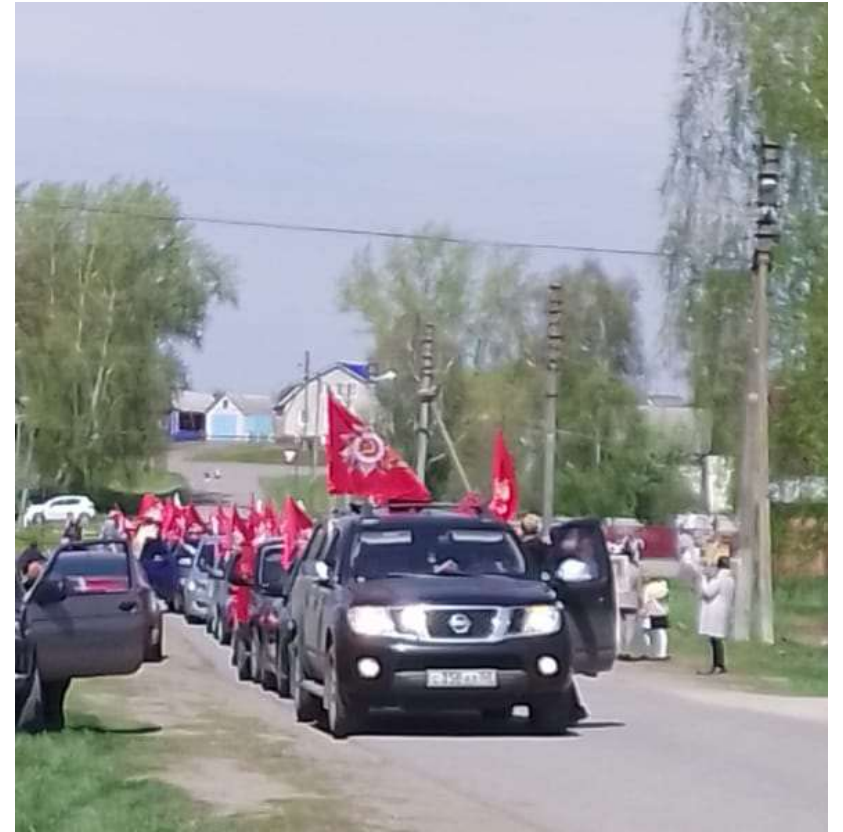
«Автопробег ко Дню Победы»