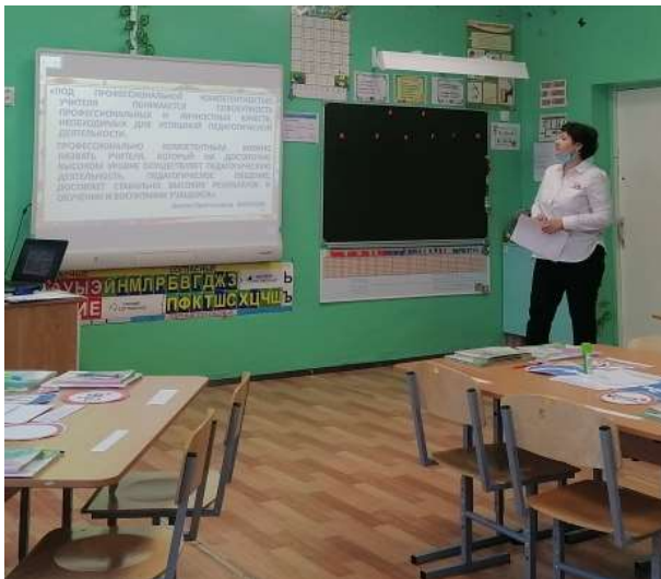
РМО учителей начальных классов